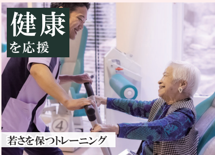
若さを保つトレーニング