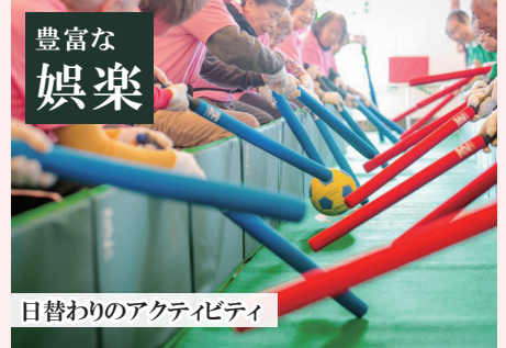
日替わりのアクティビティ