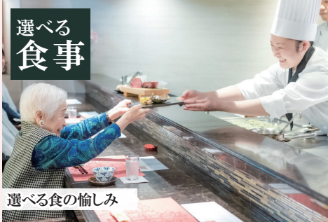
選べる食の愉しみ