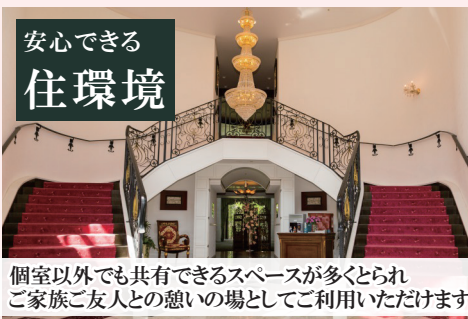
個室以外でも共有できるスペースが多くとられ、ご家族ご友人との憩いの場としてご利用いただけます