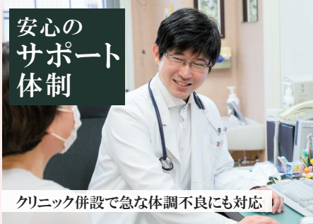
クリニック併設で急な体調不良にも対応