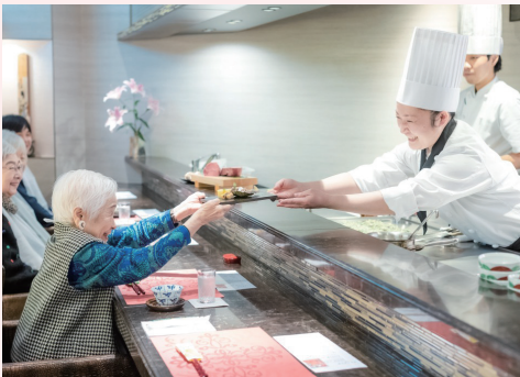
■選べる食の楽しみ