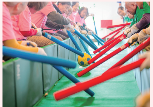
■365日愉しめるアクティビティやイベント