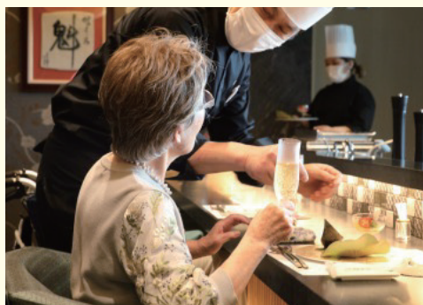
和・洋・中 選べる6つのレストランとメニュー