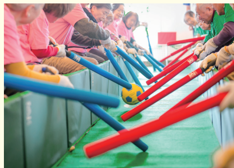
365日愉しめるアクティビティやイベント