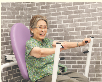
若さと健康を保つエイジレストレーニング